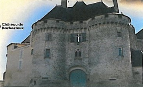
7 Château de Barbezieux