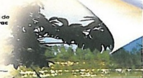
4 Etangs de Touvérac