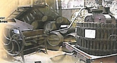
6 Musée du Cognac de Lamerac