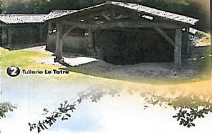
2 Tullerie Le Tâtre