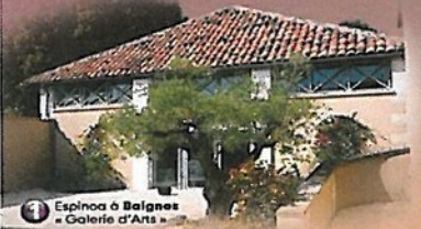
1 Espinosa à Baignes « Galerie d'Arts »