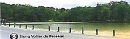
3 Etang Vallier de Brossac