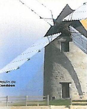
5 Moulin de Condéon