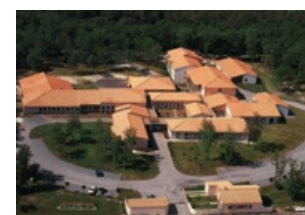
Lycée professionnel agricole Félix Gaillard Chez Fouquet - Salles de Barbezieux 05 45 78 03 17