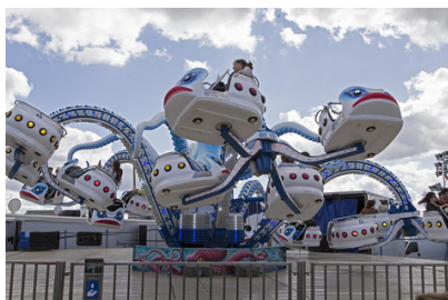
Les fêtes foraines de Pâques Du weekend des Rameaux au lundi de Pâques, profitez de la fête foraine à Plaisance.