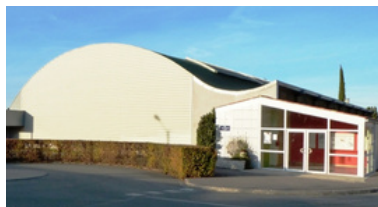
Gymnase Jean Moulin Chemin Noir Salle de réunion, salle de sports.