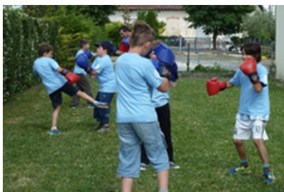
La journée multisports Destinée aux enfants de 7 à 13 ans, elle a pour but de les initier à diverses disciplines sportives de leur choix