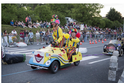
La course de caisses à savon Les bolides s'affrontent dans une course folle.