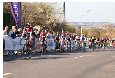
La course cycliste des rameaux et La course cycliste semi-nocturne, Le tour cycliste 4B Pour les passionnés de vélos