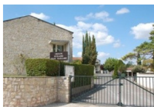
Ecole primaire Jacques Prévert Site Félix Gaillard : 7, Avenue Bernard Fisher Site Jacques Prévert : 12, Avenue Pierre Mendès France 05 45 78 01 87 / 06 31 60 37 33