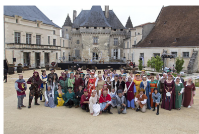
Fête médiévale Camp médiévale, exposants, danses, concert...