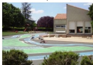
Ecole maternelle Les Alouettes 27 bis, rue de Wolfratshausen 05 45 78 23 19