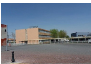
Collège public Jean Moulin Avenue de Vignola 05 45 78 19 88

Services périscolaires gérés par la CDC4B Garderie : à partir de 7h30 le matin et jusqu'à 19h le soir www.cdc4b.com 05 45 78 89 09