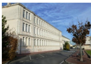
Lycée général et technologique Elie Vinet 7, Avenue Pierre Mendès France 05 45 78 17 27