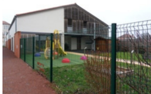
Crèche « Drôle de Graines » 4 ter, Av. Pierre Mendès France 05 45 78 64 01