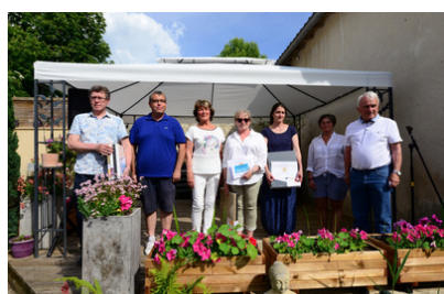
Le concours des peintres Les plus belles toiles sur Barbezieux sont récompensées