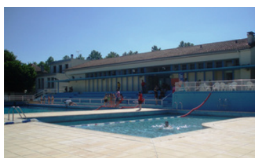
Piscine communautaire Nelson Pailloux 5 bis Boulevard Chanzy 05 45 78 02 40