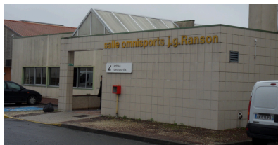
Gymnase Jean-Guy Ranson Avenue Pierre Mendès France Salle de réunion, dojo, salle de sports avec mur d'escalade, salle de remise en forme, salle d'expression corporelle.