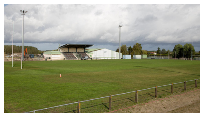
Stade Jean Pauquet Allée des Sports