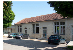
Le centre de loisirs (CSC) 11, rue Trarieux 06 58 87 00 33