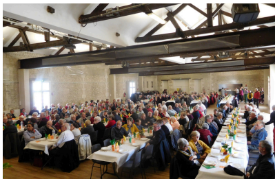
Le repas des aînés Moment convivial où les aînés se retrouvent pour partager un repas offert par la municipalité et profiter d'un bal.