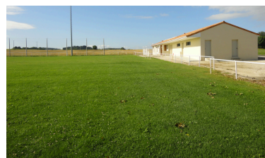
Stade Marcel Renaudin Saint-Hilaire