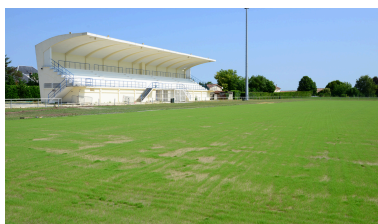
Stade Gilbert Santiago Avenue Charles Virolleau