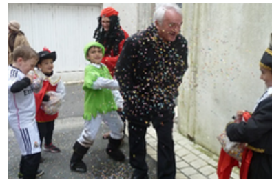
Le carnaval des enfants Toutes les écoles se retrouvent pour un défilé costumé.