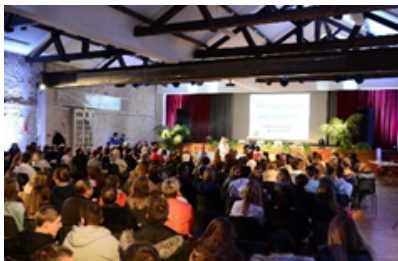
La soirée Récompenses aux sportifs Cette cérémonie organisée par la municipalité récompense les exploits de nos sportifs.