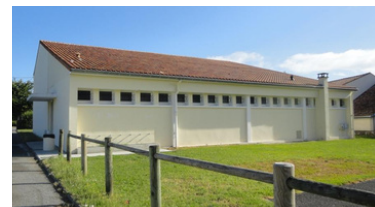
Gymnase Christian Girard Avenue Aristide Briand Salle de sports